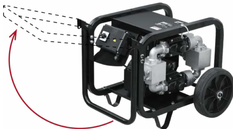
PRAKTISCHES KIT: AUSFÜHRUNG MIT RÄDERN UND GRIFF