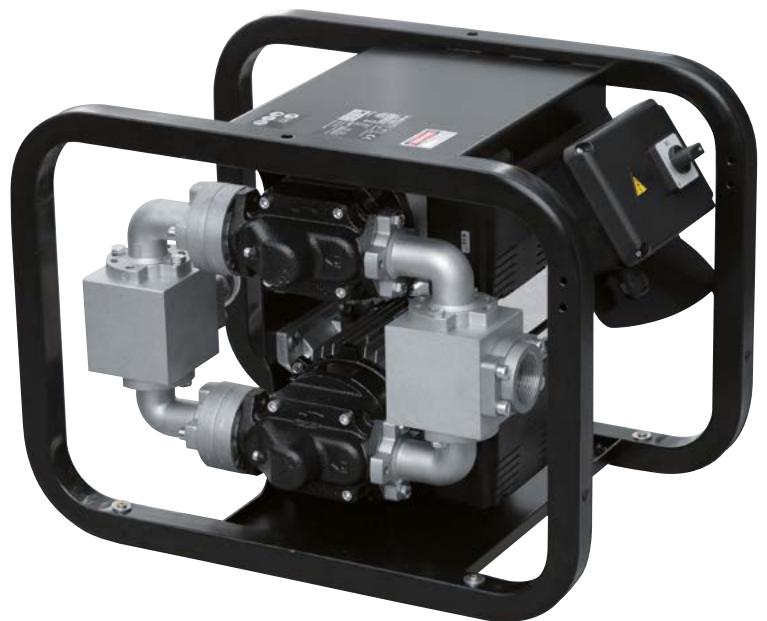
ST 200 AC